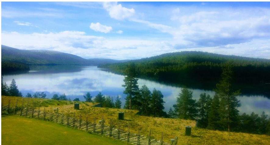
Utsikt fra Savalloftet

for alle som har deltatt på kurs i Rosenmetoden, og kjenner at de kan ivareta sin egen prosess